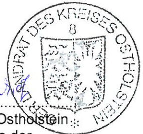
Der Landrat des Kreises Ostholstein als Aufsichtsbehörde der Wasser- und Bodenverbände